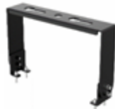
ขาจับ (Bracket) ปรับองศา